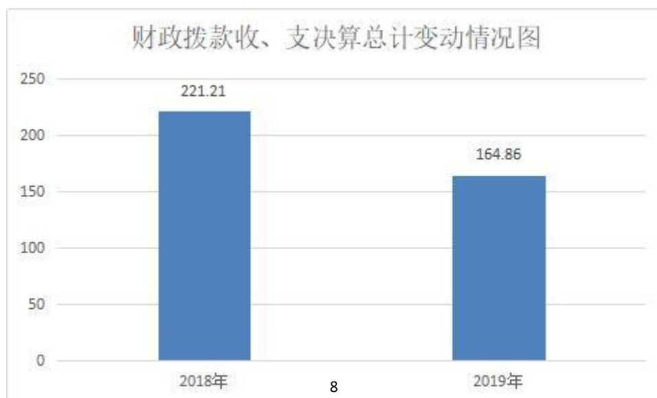
(图4: 财政拨款收、支决算总计变动情况)(柱状图)

2019 年财政拨款收、支总计 164.88 万元。与 2018 年相比，财政拨款收、支总计各减少 56.35 万元，下降 25%。主要变动原因是财政拨款预算资金减少，工作中厉行节约，最大限度减少开支。