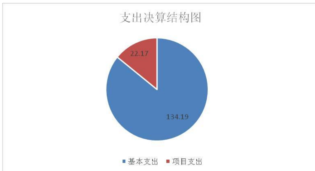
(图3: 支出决算结构图)(饼状图)