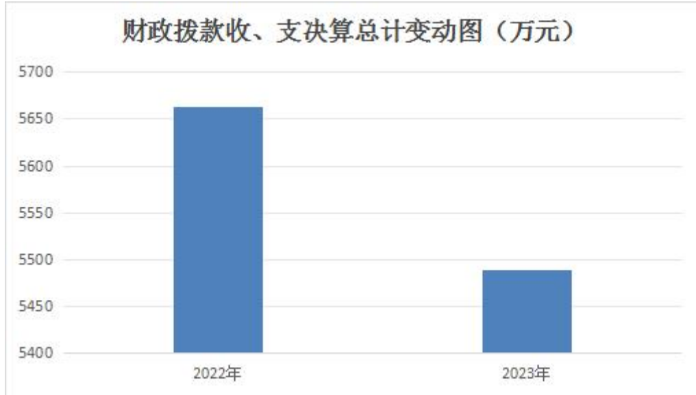
图 4：财政拨款收、支决算总计变动图

2022 年度相比，财政拨款收、支总计各减少 190.35 万元，下降 3.35%。主要变动原因竹园博物馆建设资金拨付差异。