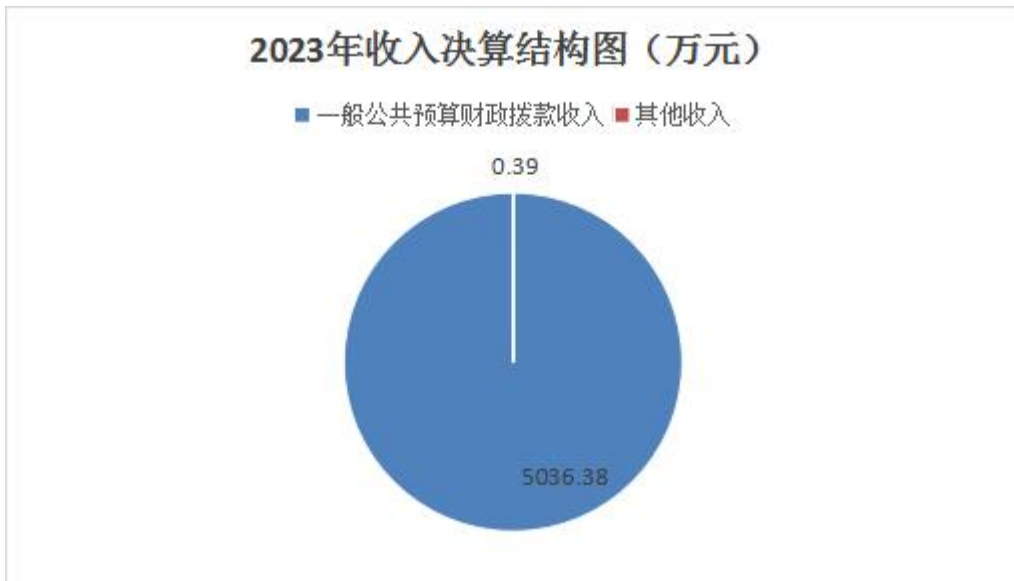
图 2：2022 年收入决算结构图