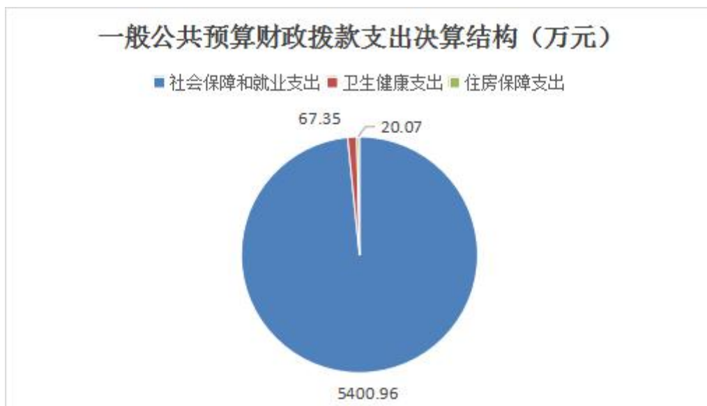
图 6：一般公共预算财政拨款支出决算结构

2023 年度一般公共预算财政拨款支出 5489.01 万元，主要用于以下方面：一般公共预算服务支出 0 万元，占 0%；教育支出 0 万元，占 0%；科学技术支出 0 万元，占 0%；文化旅游体育与传媒支出 0 万元，占 0%；社会保障和就业支出 5400.96 万元，占 98.40%；卫生健康支出 67.35 万元，占 1.23%；住房保障支出 20.07 万元，占 0.37%。