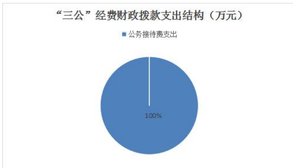
图 7：“三公”经费财政拨款支出结构

(境) 费支出决算 0 万元，占 0%；公务用车购置及运行维护费支出决算 0 万元，占 0%；公务接待费支出决算 1.85 万元，占 100%。具体情况如下：